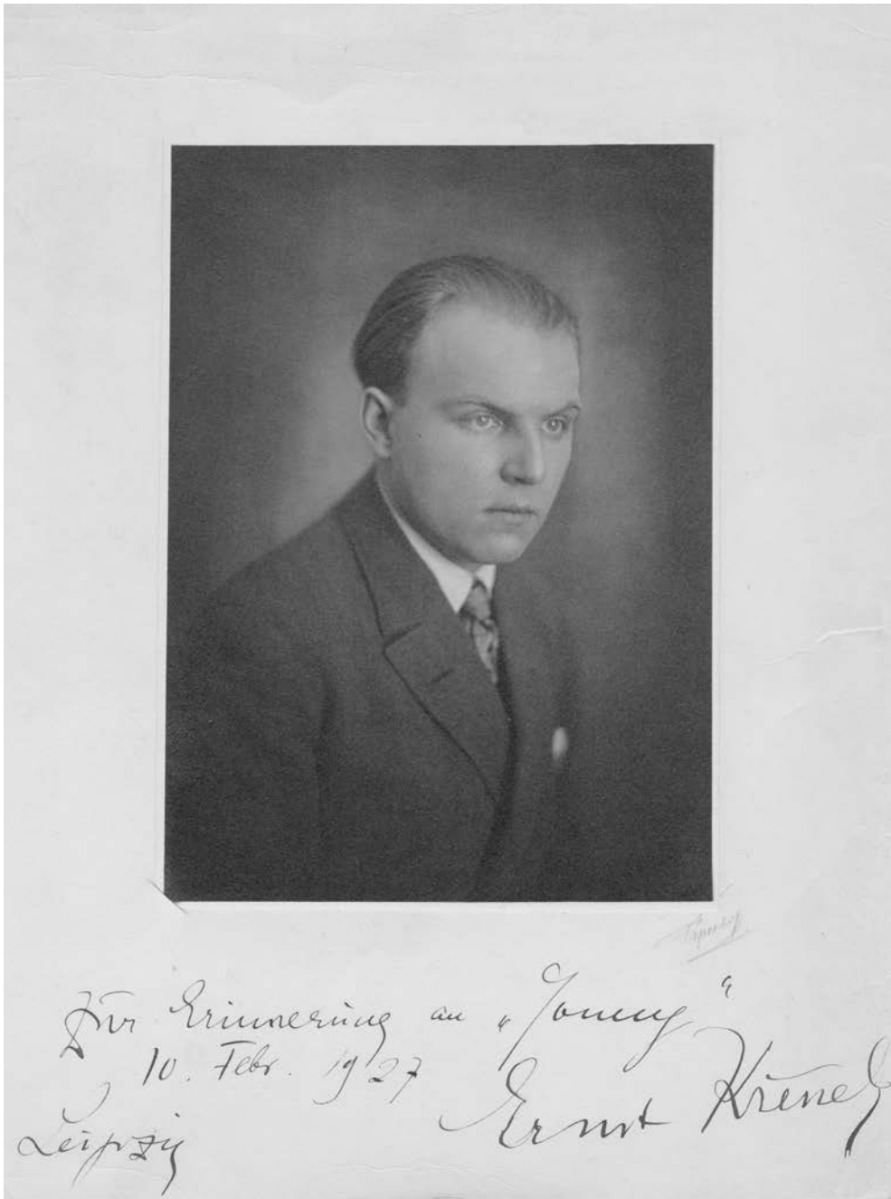
ABBILDUNG 3 Kreneks Porträtfoto für Walther Brüggemann.