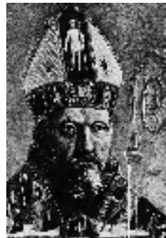
Abb. I.2.3: Augustinus (345-430)