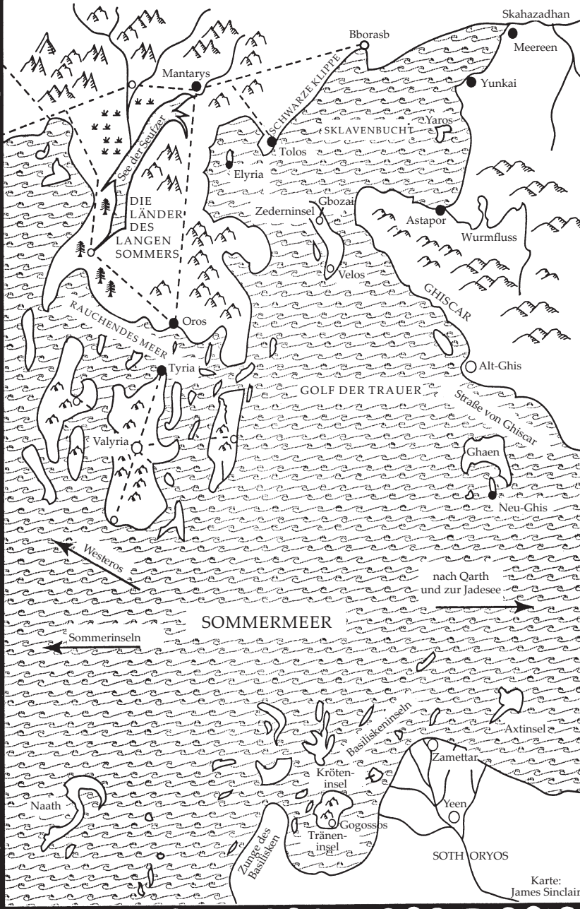
Karte: James Sinclair