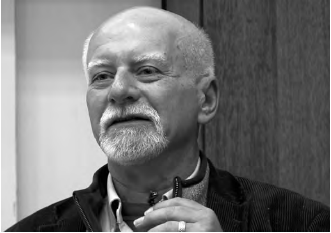
Mr. X-Men Chris Claremont (* 1950), hier an der Columbia University 2014.

hüllung schockiert, einer der gefährlichsten Gegner der Gefolgschaft des edlen Professors Charles Xavier, der radikale Menschenfeind und »Master of Magnetism« Magneto, habe sich keineswegs aus Lust und Laune zu seinem Partisanenkrieg gegen die Menschheit entschlossen. Denn wir, die Angehörigen der Gattung Homo sapiens, diskriminieren und verfolgen bei Claremont die Mutanten, und Magneto ist nur deshalb Terrorist geworden, weil er schon einmal hat erleben müssen, wie eine Gemeinschaft, zu der er gehört, ausgegrenzt, unterdrückt und schließlich mit Ausrottung bedroht worden war. Magneto, Erik Magnus Lensherr, ist bei Claremont nämlich ein Überlebender der Vernichtungsmaschinerie der Nationalsozialisten.